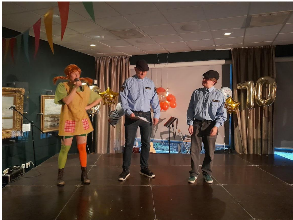
Skövde Musikteater gav smakprov sin kommande föreställning Pippi Långstrump.